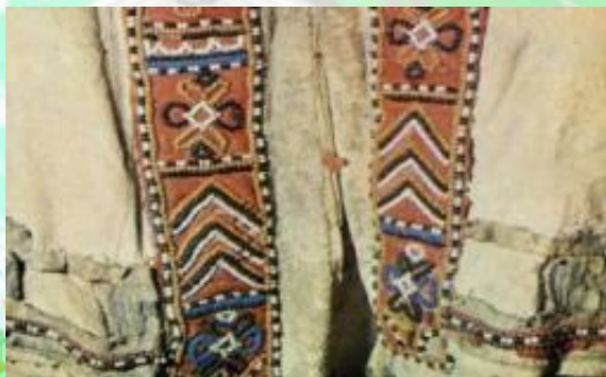
Вышивка оленьим волосом